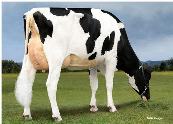
PROGENESIS JEDI HOLOCRON DAM