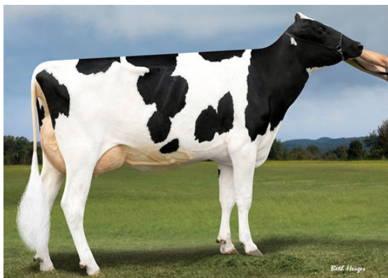
PROGENESIS JEDI HOLOCRON DAM